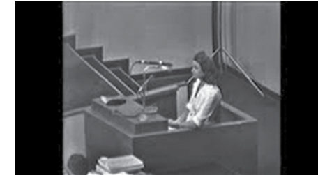
استر غولدشتاين عند تقديم شهادتها في محاكمة ايخمان

ولكن فشل هذه المحاولة معروف مسبقاً والصدمة التي من غير الممكن التعبير عنها تتفجر في كل مرة من جديد. كما اللحظة الموثقة في الصورة الفوتوغرافية، والتي ترافق عائلته كظلمها وتنفجر بشكل عشوائي، هكذا تعود الصدمة وتجلجل من قلب الضجيج وروتينيّة العمل.