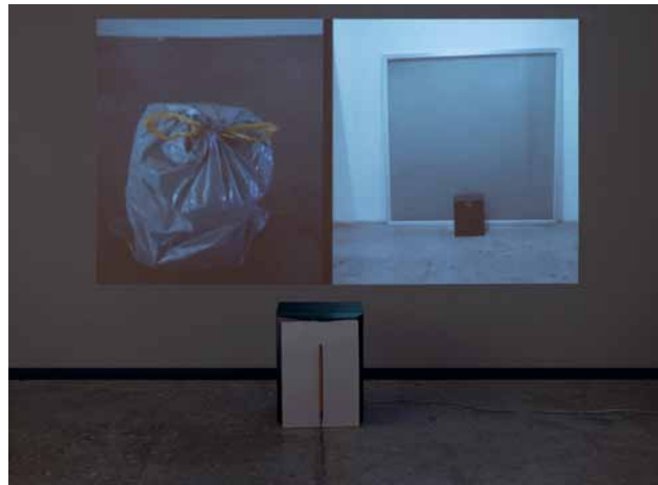
גיא גולדשטיין, שלל III, 2011, רמקול, דף נייר מודפס, סאונד ווידאו ג'י גולדשטיין, גניבת רמקול III, 2011, מיקרופון, ורקה מודפסה, סאונד ווידאו Guy Goldstein, Loot III , 2011, Speaker, printed page of paper, video with sound