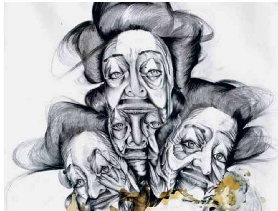
רועי חפץ, פרט מתוך טריו, 2012, טכניקה מעורבת על גבי נייר, 150x280 ס"מ, באדיבות סרג' תירוש ואוסף ST-ART רועי חפץ, ثلاثي، 2012، تقنية مختلطة على ورق، 150x280 سم، بلطف من سرجي تيروش ومجموعة ST-ART Roey Heifetz, detail from Trio , 2012, Graphite, oil and ink on paper, 150x280 cm, Courtesy of Serge Tiroche & ST-ART collection