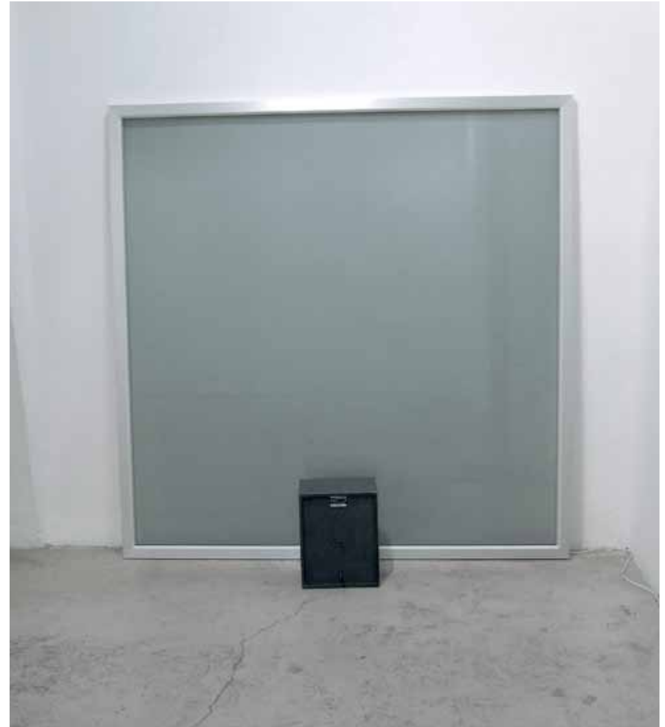
גיא גולדשטיין, שלל I, 2009, חלון זכוכית ואלומיניום, 150x150 ס"מ, רמקול וסאונד جي غولداشتاين، غنيجة رقم 1، 2009، نافذة من الزجاج والألومنيوم، مكبر صوت وصوت، 150x150 سم Guy Goldstein, Loot I , 2009, Glass and aluminum window, speaker and sound, 150x150 cm