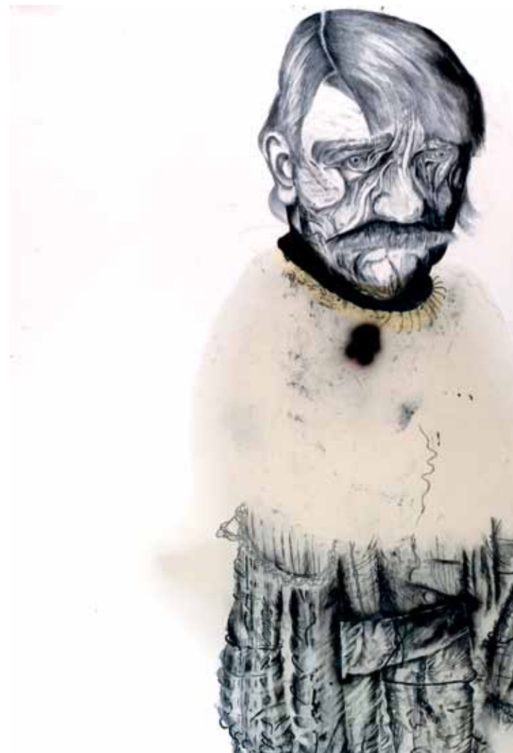
רועי חפץ, ללא כותרת, 2009, טכניקה מעורבת על גבי נייר, 150x300 ס"מ, באדיבות סרג' תירוש ואוסף ST-ART רועי חיפטס, ידון ענואן, 2009, תפנית מכלת על ורק, 150x300 סמ, בלפ מן סרגי תירוש ומجموعة ST-ART Roey Heifetz, Untitled , 2009, Graphite, oil and ink on paper, 150x300 cm Courtesy of Serge Tiroche & ST-ART collection