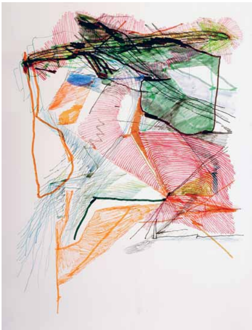
הילה טוני נבוק, רישום קריסה מס' 4, 2005, עפרונות צבעוניים ועטי לבוד על נייר, 50x65 ס"מ הילה טוני נבוק, صورة إيضاحية للانهييار رقم 4، 2005، أقلام رصاص ملونة وأقلام على ورق، 50x65 سم Hila Toony Navok, Collapse Drawing #4 , 2005, Colored pencil and felt-tipped pen on paper, 50x65 cm