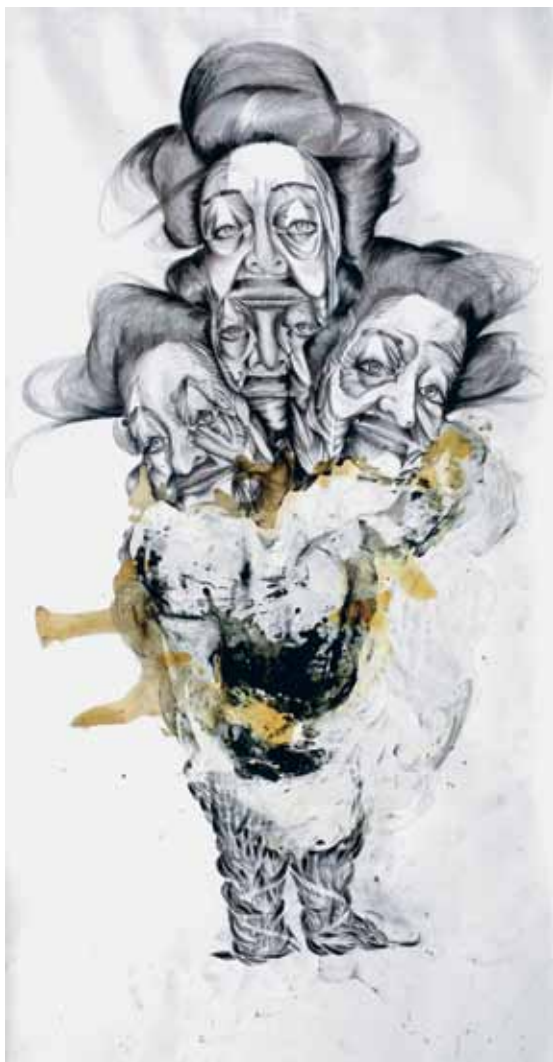
רועי חפץ, טריו, 2012, טכניקה מעורבת על גבי נייר, 150x280 ס"מ, באדיבות סרג' תירוש ואוסף ST-ART רועי חיפטס, תלתי, 2012, תפנית מכלת על ורק, 150x280 סמ, בלפ מן סרגי תירוש ומجموعة ST-ART Roey Heifetz, Trio , 2012, Graphite, oil and ink on paper, 150x280 cm Courtesy of Serge Tiroche & ST-ART collection