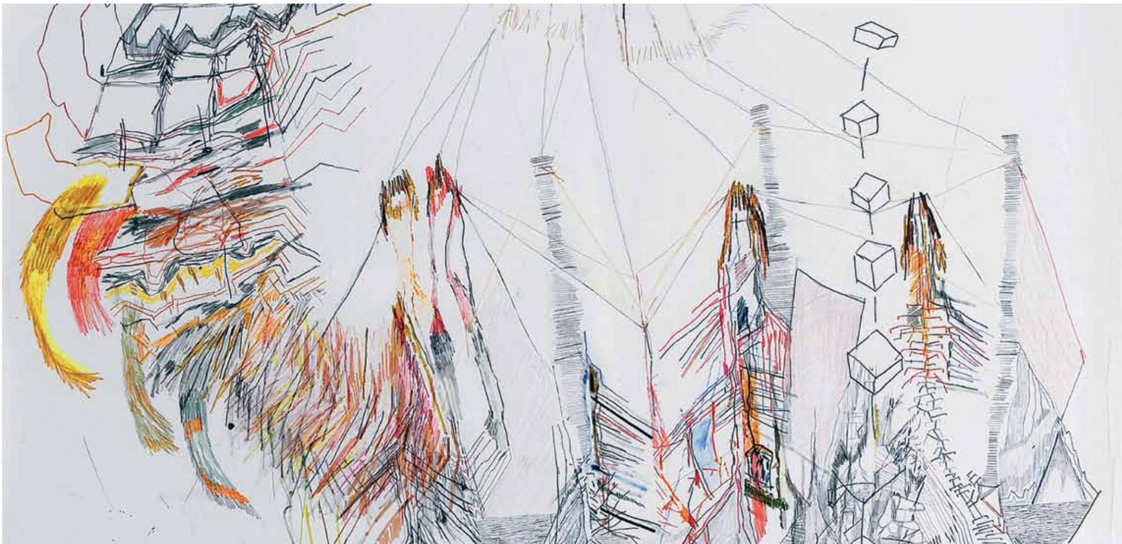
הילה טוני נבוק, פרט מתוך רישום קריסה מס' 3, 2005, עפרונות ועפרונות צבעוניים על נייר, 105x140 ס"מ هילה طوني نفوك، صورة إيضاحية للانهيار رقم 3، 2005، أقلام رصاص وأقلام رصاص ملونة على ورق، 140 × 105 سم Hila Toony Navok, detail from Collapse Drawing #3 , 2005, Pencil and colored pencil on paper, 105x140 cm