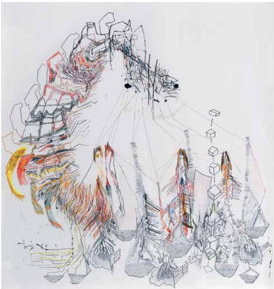
הילה טוני נבוק, רישום קריסה מס' 3, 2006, עפרונות ועפרונות צבעוניים על נייר, 105x140 ס"מ هیلا طوني نفوك، صورة إيضاحية للانهييار رقم 3، 2006، أقلام رصاص وأقلام رصاص ملونة على ورق، 140x105 سم Hila Toony Navok, Collapse Drawing #3 , 2006, Pencil and colored pencil on paper, 105x140 cm